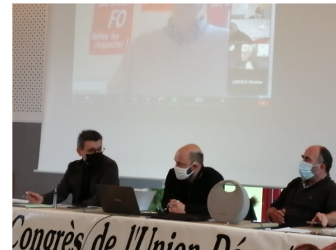
Une tribune à l'écoute