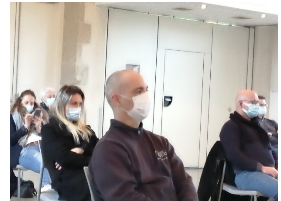
un auditoire attentif aux débats.