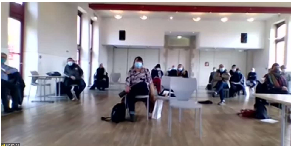
Vue de l'auditoire présent salle des Petites Ecuries des Oudairies (La Roche S/Yon)